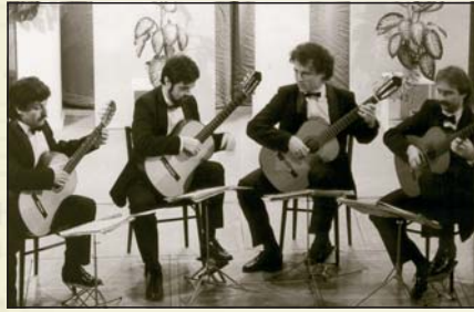
Pražské kytarové kvarteto, 6.12.1990