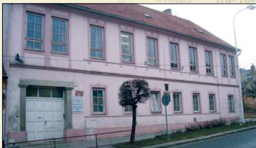
Bývalá budova ZUŠ T. Sviny (čp. 248) v roce 2009

odstranění střešní konstrukce, došlo k narušení statiky celé budovy a budova musela být stržena. V březnu 1989 opuští LŠU na čas také prostory na státním hradě v Nových Hradech z důvodu rekonstrukce celého objektu. Toto období neustálého stěhování se nedotklo pouze detašovaných tříd v Ledenicích a v Borovanech (od r. 1986), kde byly vyučovací prostory beze změn. V Trhových Svinech