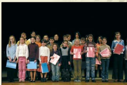
Dětský pěvecký sbor Zvonky, Thové Sviny

V roce 2007 se sborový zpěv rozšířil i do Besednice a vznikl soubor „Vážky“. Zpívá v něm 15 žáků od 7 do 13 let. Oba sbory spolupracují a pravidelně vystupují na vánočním a závěrečném koncertu ZUŠ v Trhových Svinech a na pěvecké přehlídce.