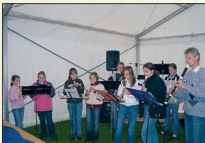
Vystoupení pro policii, 2.6.2006