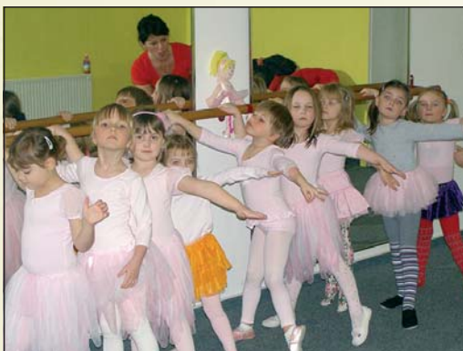
Taneční obor na Hluboké nad Vltavou