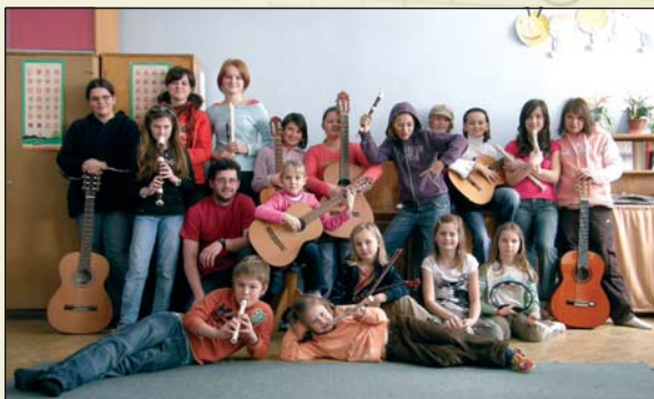
Žáci ZUŠ v Malontech