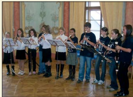
Cvrčci na Přehlídce komorních souborů v Nových Hradech, 2008