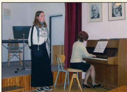
Z koncertu 19.12.2005