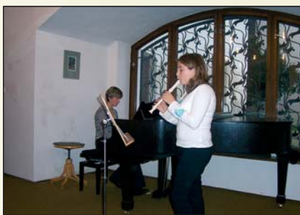
Žakovský koncert, 22.10.2007

Díky jejich práci se v průběhu půl století podařilo vychovat mnohé výborné muzikanty, kteří pak v hraní pokračovali i po opuštění školy a někteří z nich si hudbu zvolili i jako své povolání nebo se jim stala celoživotním koníčkem. Díky jejich úsilí tak nadále přetrvává tradiční spojení hudby a našeho města a osad, nemusíme pouze vzpomínat na slavná jména spjatá s historií, ale máme i dnes své vlastní muzikan-