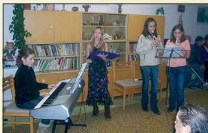
Vystoupení v DPS N. Hradý, 11.12.2007

ty, kteří jsou novodobými nositeli této tradice.