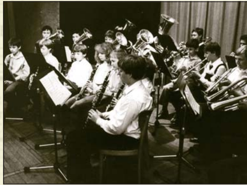
Školní dechový soubor, rok 1984