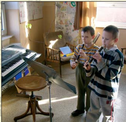
Při výuce na zobcovou flétnu