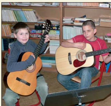
Výuka na kytary