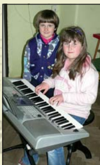
Výuka na klávesy