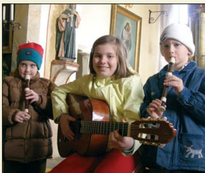
Hraní v kostele