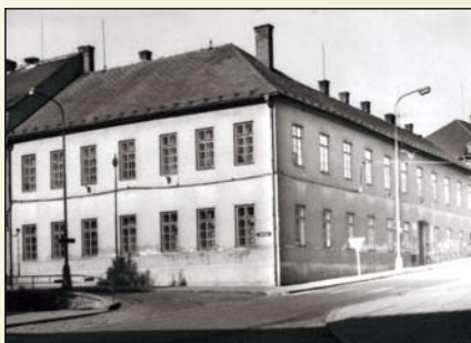
Budova bývalého soudu Husova ulice

Od září 1969 byla v Trhových Svinech zřízena samostatná LŠU s detašovanými třídami v Nových Hradech a Ledenicích. V tomto roce byla také zahájena výuka výtvarného oboru. Od roku 1980 se stále zhoršoval stav budovy v Husově ulici, ve kterém LŠU v té době sídlila. Stav byl tak vážný, že bezpečnostní technik ONV zastavil v této budově výuku žáků, a to k 31. 3. 1988. Výuka tak musela být přesunuta do náhradních prostor. V následujícím roce byla zahájena rekonstrukce této budovy, která však netrvala dlouho. Po