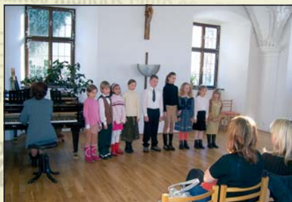
Adventní koncert, 15.12.2005