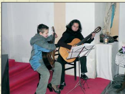
Koncert v kostele