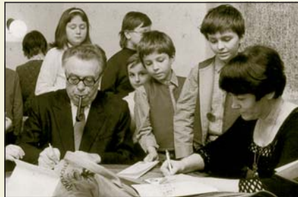
Ilja Hurník na besedě po koncertě, 1983