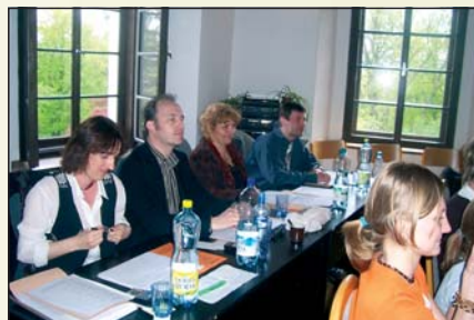
Novohradská flétna 2008

Mezi vedlejšími aktivitami má nejdelší tradici Kruh přátel hudby. Pod tímto názvem škola organizuje cyklus koncertů (6 – 8 koncertů v sezoně), které jsou určeny nejen všem milovníkům vážné hudby, ale zejména žákům školy. Ti mohou navštěvovat tyto koncerty zcela bezplatně. Koncerty jsou pořádány nepřetržitě od roku 1975.