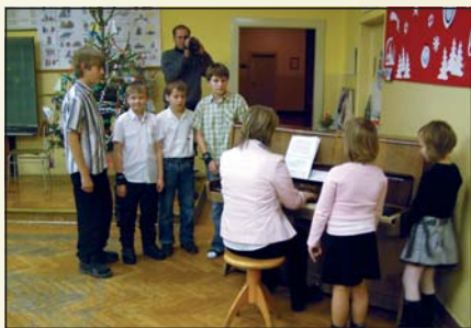
Vánoční koncert ve škole

Hry na hudební nástroj se tento rok účastní 10 žáků. Vyučuje se zde hra na akordeon a kytaru a výuka probíhá jedenkrát týdně.