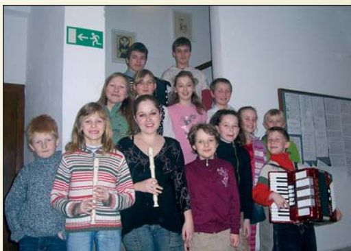
Koncert žáků, 26.3.2009