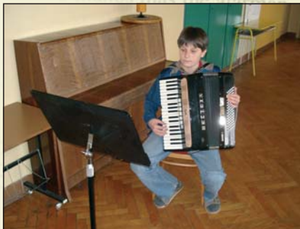
Výuka na akordeon