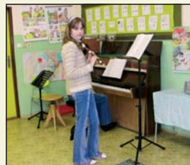
Ve škole při výuce