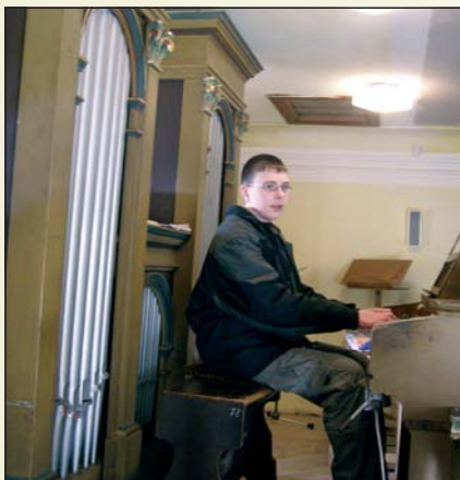
Hra na varhany v kostele