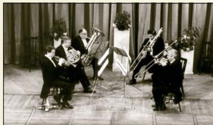
Pražští žeství sólisté, 14.5.1984