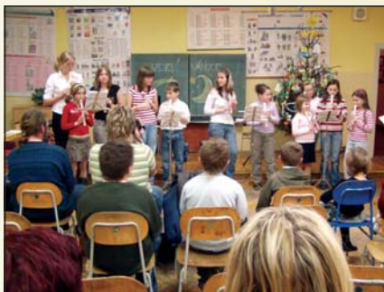
Vánoční koncert ve škole