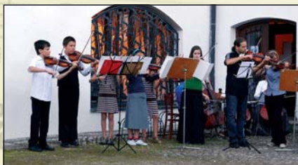
Vystoupení před ZUŠ N. Hrady

Přeji vám v T. Svinech, aby vaše „No- vohradská flétna“ stále pokračovala a vždy probíhala v klidu a radosti. Děkuji také za