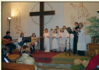
Koncert ZUŠ, 2005