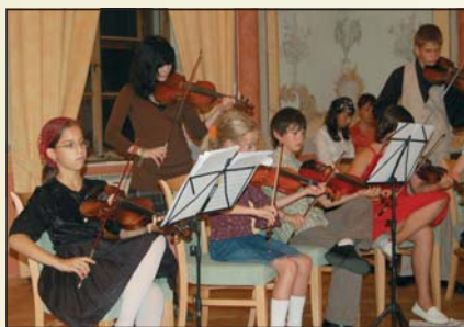
Jeden z koncertů účastníků kurzů v Rezi- denci v N. Hradech

Na veškeré aktivity se snažíme využí- vat možností grantů, příspěvků nadací, obcí i sponzoringu, což je v místních pod- mínkách zvláště obtížné.