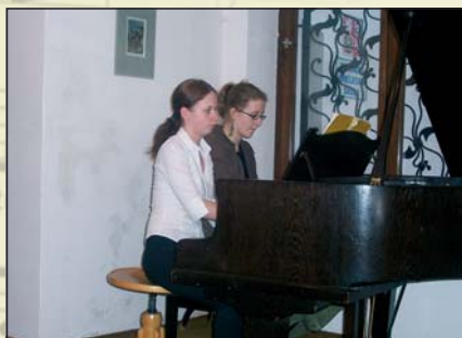
Absolventský koncert, 14.3.2008