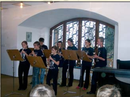
Cvrčci na Přehlídce komorních souborů, 9.11.2005

Své první vystoupení si mladí flétnisté odbyli na vánočním koncertu žáků v roce 2001. Od té doby už odehráli mnoho veřejných vystoupení nejen u nás, ale i v zahraničí. Soubor vystupoval několikrát v sousedním Rakousku v nedaleké Weitře a Harbachu.