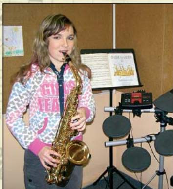
Při výuce na saxofon