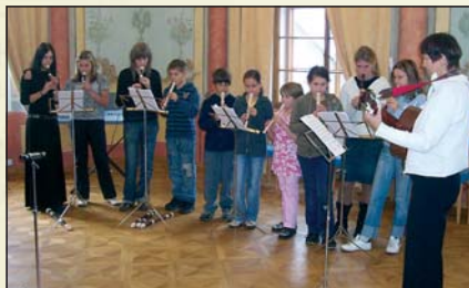
Přehlídka komorních souborů, Nové Hradky, 7.11.2008

Stejně dlouhou, již šestiletou tradici, má též celonárodní „ Přehlídka komor- ních souborů “, která se první 2 roky usku- tečnila na třech místech (v Trhových Svi- nech, v Nových Hradech a v Hluboké nad Vltavou). V současné době se přehlídka koná pouze v T. Svinech a v N. Hradech.